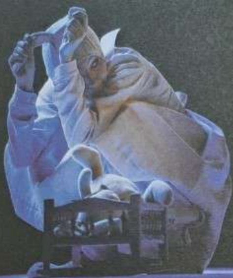
Jelenet a Fehér altató című előadásából – Patchwork Fesztivál