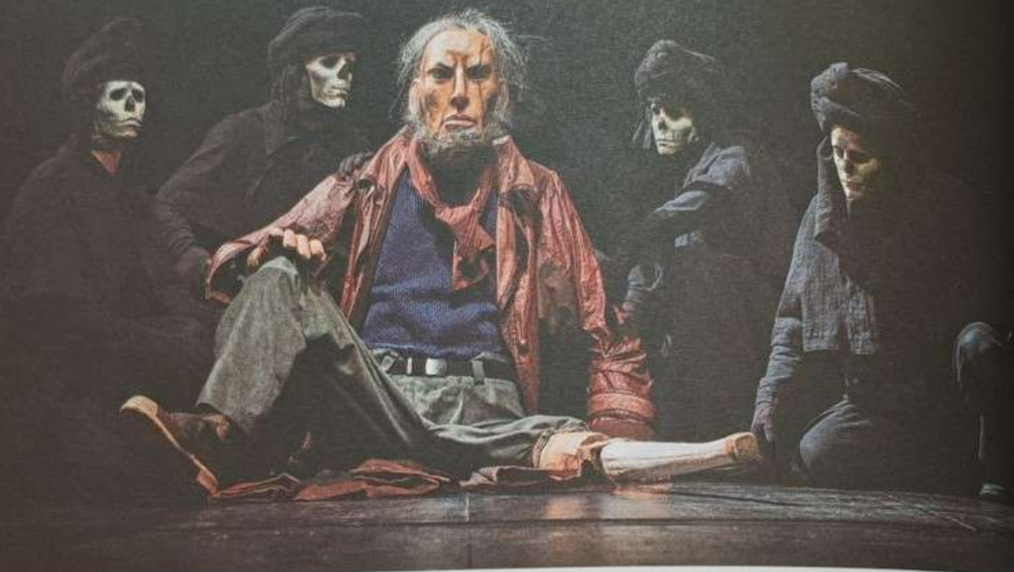
Jelenet a Moby Dick című előadásból – Patchwork Fesztivál