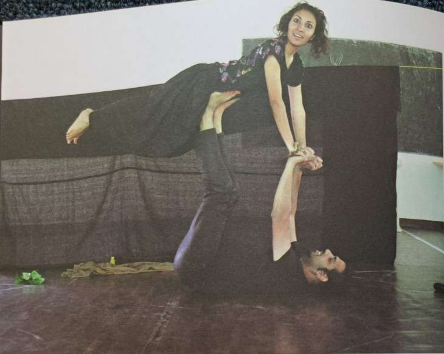
Jelenet a Colors című előadásából – Senses Fesztivál

fejlődése igazán csak közösségben lehetséges, mindenképpen hasznosak ezek a beszélgetések, foglalkozások. Általában két felkészült szakember vezeti a foglalkozásokat, de mindig része a találkozásnak, és nagyon szeretik a gyerekek, amikor a színészekkel dolgozhatnak. Különösen hatásos, amikor a színész a szerepében marad, és azt az álláspontot képviseli, amit az előadásban is. Persze civilként, magánemberként is elindíthatják a beszélgetést az előadásban felvetett témáról: barátságról, szerelemről, házasságról, válásról... Mindebben benne van, ami a szerintem a színház lényege. A színház: lélek, élmény, erő, az én és a mi találkozása.